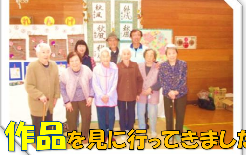
作品を見に行ってきました!

皆さん日頃からいろいろな趣味活動に取り組まれています! たくさんある作品の中から鳥井町の文化祭に出展しました!