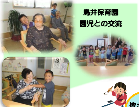
鳥井保育園 園児との交流