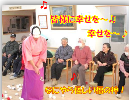
皆様に幸せを～♪ 幸せを～♪

カミナリの音と共に赤鬼！青鬼！の登場で～す ♥ 最初は調子良かったけど？あつと言う間に…？