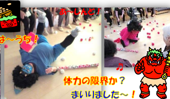
体力の限界か？ まいりました～！

カミナリの音と共に赤鬼！青鬼！の登場で～す ♥ 最初は調子良かったけど？あつと言う間に…？