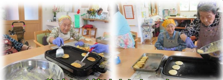
美味しく焼きましたー!

こまめな水分補給、室内の温度、衣類の調整など行い、日頃から体調管理に努めましょう!