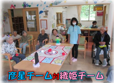
彦星チーム対織姫チーム