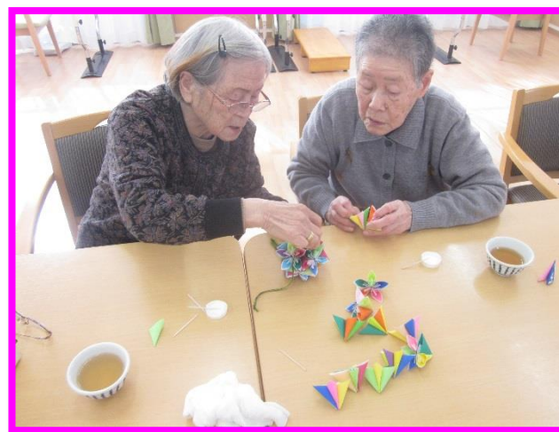
折り紙を使って飾り作り