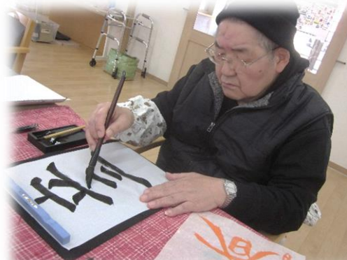
皆さん集中しておられますね～