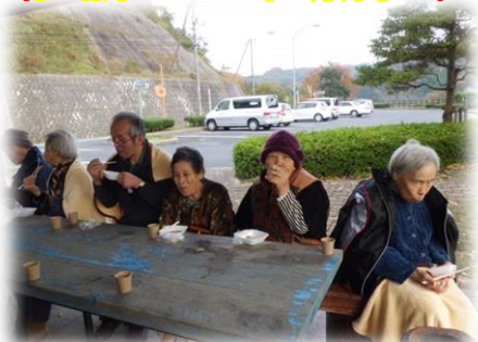
つるし柿にしました! ホカホカ懐かしい味ですネ♥ 「秋だね～山はちょっと寒いなあ～」 早く食べたいなあ～♥

「鳥井町文化祭」に初めて、皆様の作品を出展しました。当日、皆様と見に行き大変喜ばれました。今後も楽しく作品作りをいたします!