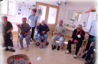
ハリキッテ 選手宣誓! 「鯛釣り」うまく釣れたかな? 闘志満々パン食い競争! 白熱の玉入れ!